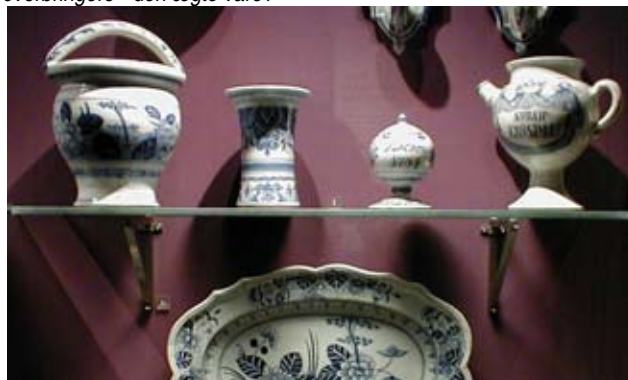
Danske fajancer fra 1700 - tallet. Fra Nationalmuseets nyåbnede permanente udstilling "Danmarkshistorier 1660 - 2000"

- Eller skal man fastholde fokus på genstandene - historiens overbringere - den ægte vare?