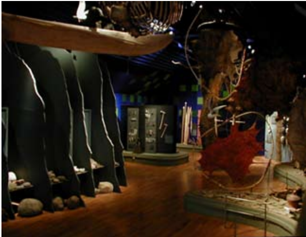
Med udgangspunkt i et originalmateriale svarende til to spande skæver, lød opgaven på at lave en udstilling, som rummer oplevelser for hele familien. Løsningen blev udstrakt anvendelse af rekonstruktioner og naturmaterialer. Stenaldercenter Ertebølle.

Det er en vanskelig balancegang - også mellem faglig forfængelighed og ydmyghed.