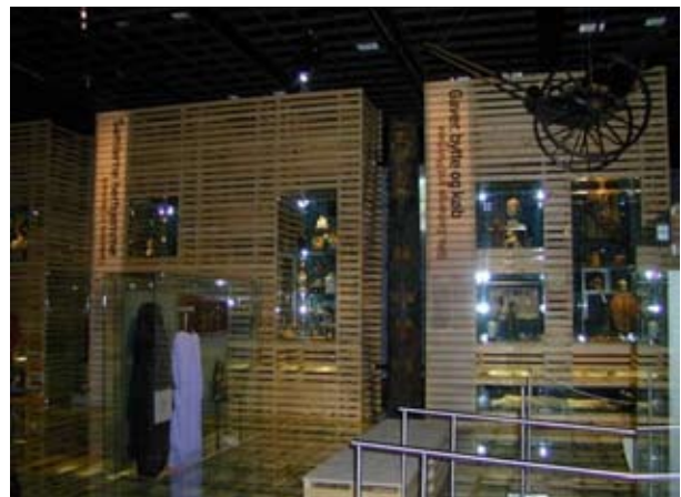
En udstilling med uomtvistelige arkitektoniske kvaliteter: "Verdensspejl"-særudstilling på Nationalmuseet 2000.

Et godt resultat er betinget af frugtbare diskussioner af disse problemstillinger - og af at begge parter er klar til at komme hinanden i møde og - give køb på egen faglighed når enderne ikke kan mødes. Blandt museumsfolk anvendes en stående vending: "Arkitekten løb med det hele", som beskrivelse af en udstilling hvor formen opleves som dominerende over - og ikke integreret med indholdet.