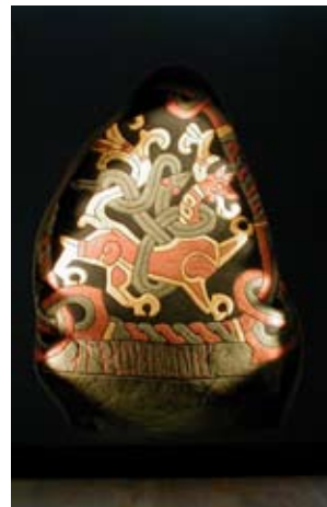
Jellingstenen er den ældste skriftlige kilde i Danmark. Her "dragesiden" af den rigtige sten - og et bud på en oprindelig bemaling som den kan ses i udstillingshuset "Kongernes Jelling" der blev åbnet i år 2000

Genstandene er således kilder eller hukommelsesfragmenter, som museumsfolkene skal forsøge at binde sammen til de fortællinger vi alle har brug for. Dilemmaet set fra en formidlers side er, at denne pointe ikke umiddelbart falder i øjnene hos mange, som vi i folkeoplysningens navn også gerne vil nå.