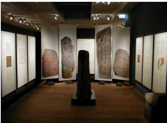
Når originalmaterialet er sparsomt og emnet stort. "Slægten", Kongernes Jelling.

Det lyder måske som et dumt spørgsmål, men er nok det vigtigste af dem alle. De faggrupper som indholdforfatterne typisk tilhører: Historikere, arkæologer, etnografer m.v. - er boglige mennesker med en masse de gerne vil fortælle og sætte på begreber.