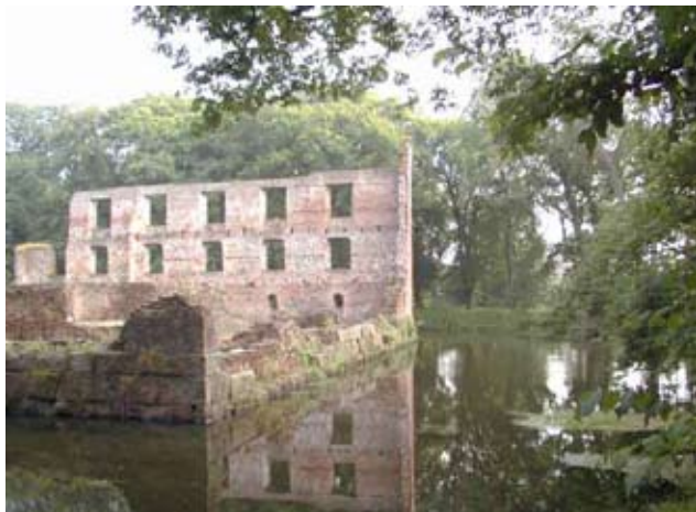
Her lå engang en stolt renæssanceborg - hvad blev dens skæbne? Trøjborg i Sydvestjylland

Identitet kræver meningsgivende fortællinger om hvorledes livet hænger sammen - og hvorfor det gik som det gjorde. Ligeså for et samfund - eller måske rettere en kultur, dér hvor de kollektive fortællinger bor. Tidligere udstak kirken livets rammer og indvævede hver enkelt i en større forklaring, som kunne tilfredsstille langt de flestes behov. I dag er vi langt mere ensomt stillede i vor søgen efter sammenhænge. Mange fravælger rationelt religionernes mysterier og står tilbage i en tid med splittede sociale relationer.