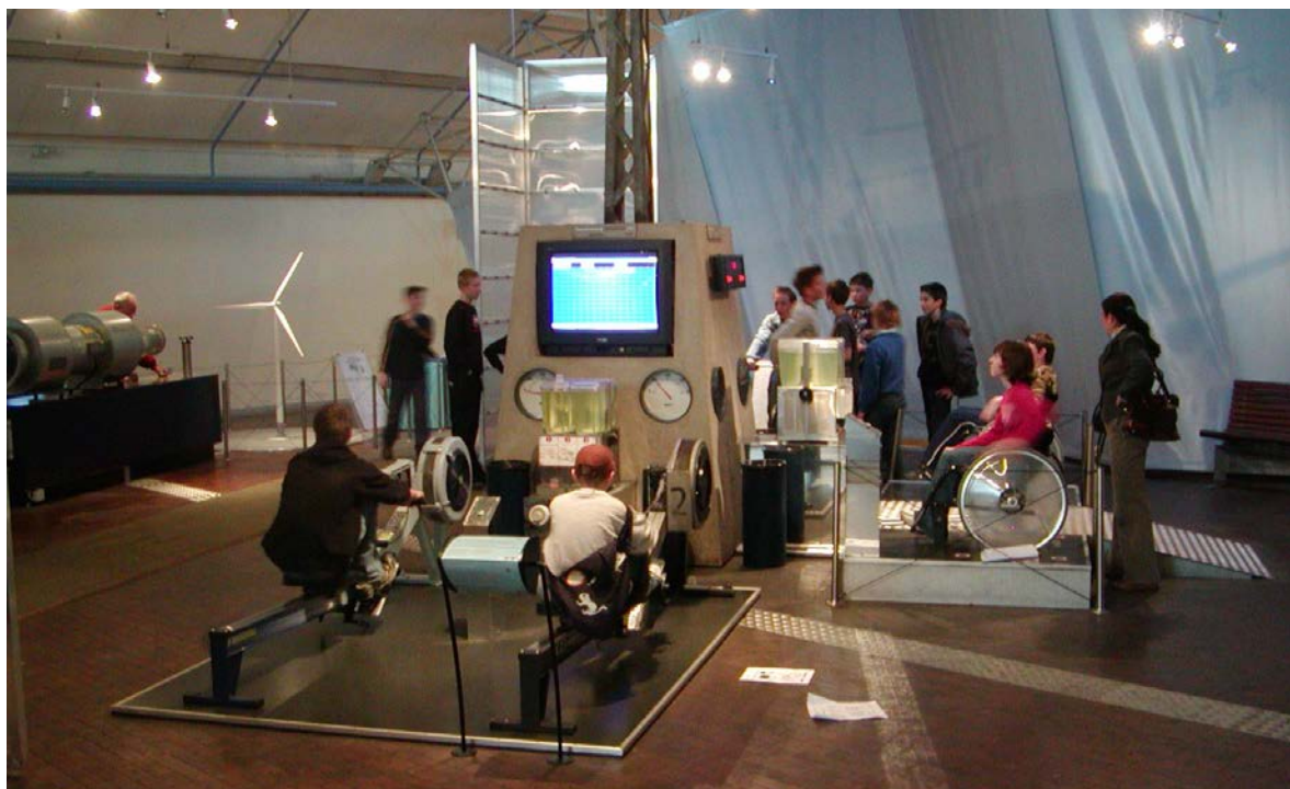
Ekspérimentarium i Hellerup. Højt aktivitetsniveau og dyre opstillinger.

Formidlingsmæssigt ser jeg filmen som et forbillede. Tv-serien Matador sparker røv når det gælder kulturbilleder og identifikation – jeg genkender jo levende barndommens billeder fra mine forældres fortællinger og den moral, de sociale idealer og den selvforståelse de videregav med deres anekdoter om et provinssamfund i 1930’erne og 40’erne. Vi kan identificere os med de levende figurer og leve os ind i de historiske rammer – og med indlevelsen næsten føle tiden.