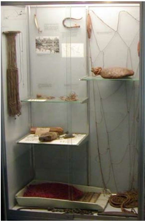
Montre primært med diffus belysning: vage skygger og svag stoflighed

Meget kort fortalt er diffus belysning karakteriseret ved at have mange retninger og ligesom lægge sig ud over det hele. Den ophæver skygger, fremhæver farve og flade - og formen på blanke ting. Diffus belysning fremkommer fra store lyskilder som himmelen, lysreflekser fra loft og vægge eller store armaturer som f.eks lysstofrør eller rispapirslamper placeret relativt tæt på det belyste.