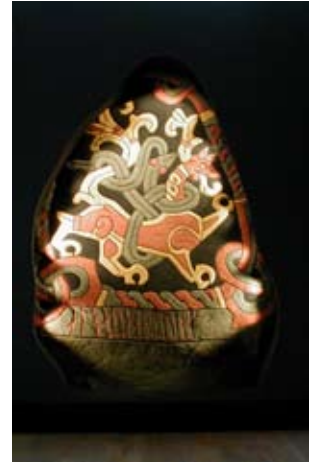
Jellingstenen er den ældste skriftlige kilde i Danmark. Her "dragesiden" af den rigtige sten - og et bud på en oprindelig bemaling som den kan ses i udstillingshuset "Kongernes Jelling" der blev åbnet i år 2000

Genstandene er således kilder eller hukommelsesfragmenter, som museumsfolkene skal forsøge at binde sammen til de fortællinger vi alle har brug for. Dilemmaet set fra en formidlers side er, at denne pointe ikke umiddelbart falder i øjnene hos mange, som vi i folkeoplysningens navn også gerne vil nå.