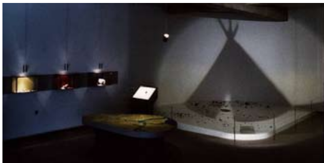
For ca. 14.000 år siden slog en gruppe rensdyrjægere lejr i tundralandskabet ved nutidens Langå. De huggede flint. Sporene blev overskyldet med lerslam, som konserverede nogle dages liv for eftertiden. Vi valgte at antyde en mulig teltform som en skygge. Kulturtrohistorisk Museum i Randers

Går vi langt nok tilbage, begynder vi i Afrika, for mere end en million år siden - men de ældste sammenhængende vidnesbyrd om menneskelig aktivitet i Danmark er mindre end tyve tusinde år gamle. Vidnesbyrd om brugen af værktøj.