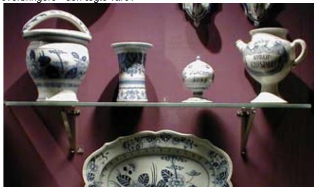
Danske fajancer fra 1700 - tallet. Fra Nationalmuseets nyåbnede permanente udstilling "Danmarkshistorier 1660 - 2000"

- Eller skal man fastholde fokus på genstandene - historiens overbringere - den ægte vare?